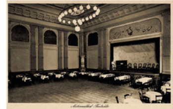
Der 'Nationalhof', etwa um 1929, als "Violetta" nach kurzer Unterbrechung wieder dorthin zurückgekehrt war

Kampf ist nötig, wenn ihr Ansehen und Achtung haben wollt."