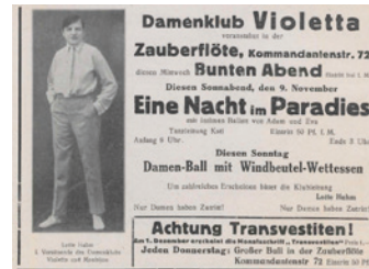
Anzeige in "Die Freundin", 1929