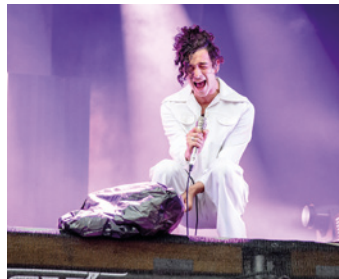
The 1975 bei Rock im Park 2016

nicht fair euch gegenüber, denn ihr seid nicht repräsentativ für eure Regierung. Denn ihr seid junge Leute, und ich bin mir sicher, dass viele von euch homosexuell und progressiv und cool sind.“ Daraufhin kommt der Bassist Ross MacDonald zu Healy, die beiden umarmen sich und finden zu einem intensiven Kuss. Wie man später auf vielen Videos in sozialen Medien zu sehen ist, jubelt das Publikum. Matty Healy verabschiedet sich vom Publikum mit den Worten „Wir wurden gerade aus Kuala Lumpur verbannt“ und die Band geht vorzeitig von der Bühne.