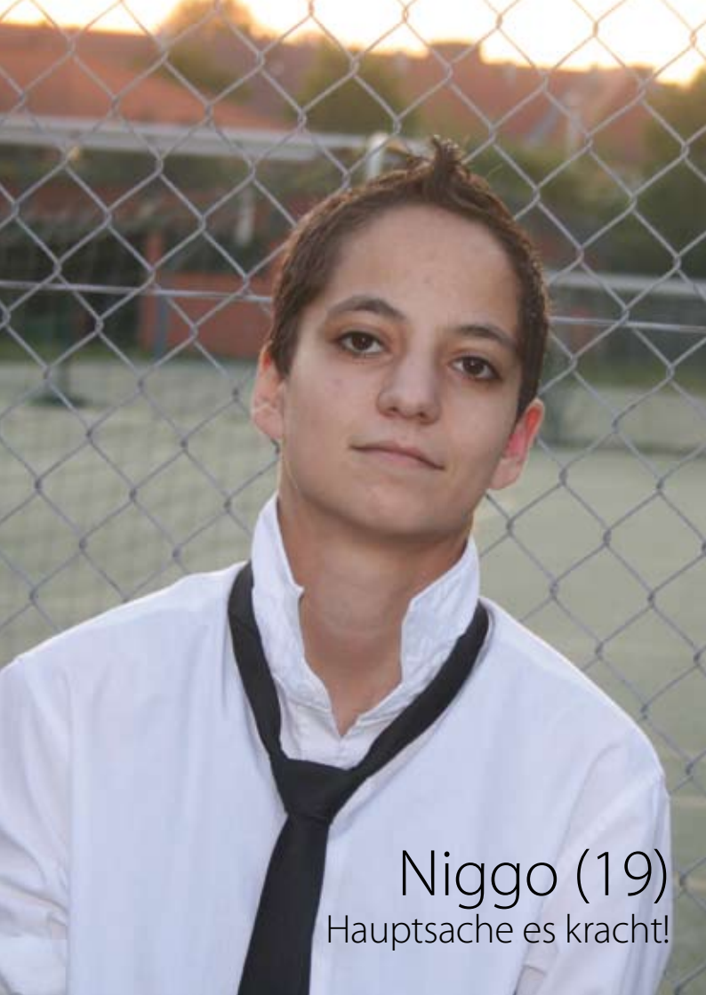
Niggo (19) Hauptsache es kracht!

Dass Fußball längst kein Männer-sport mehr ist und Frauen diese heterosexuelle männliche Bastion erobert haben, zeigte sich spätestens bei der Weltmeisterschaft 2007 und dem triumphalen Sieg der deutschen Mannschaft. Vor allem lesbischen Frauen haben diese Sportart entdeckt.